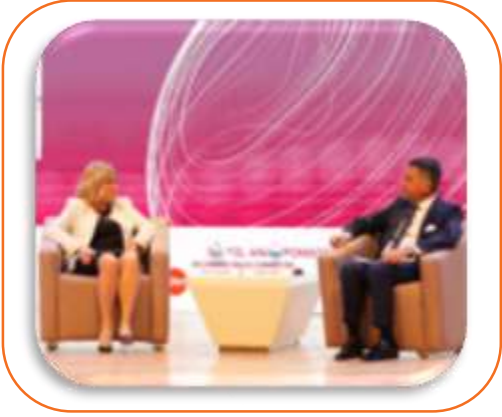
DUO/TRIO OTURUMLAR 20 DK