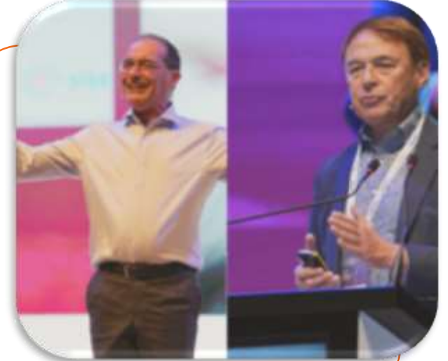
AÇILIŞ KEYNOTE OTURUMLARI