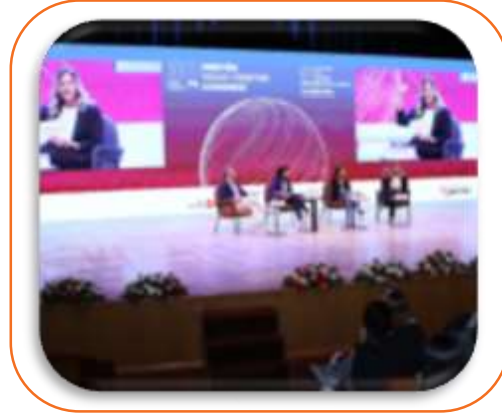
PANEL OTURUMLARI 30 DK