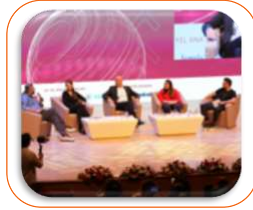
KAPANIŞ OTURUMLARI 30 DK