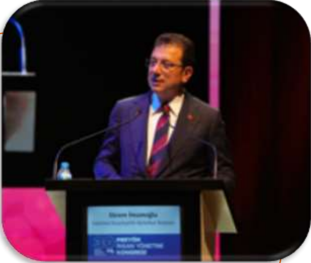
KONGRE AÇILIŞ ÖZEL KONUŞMASI