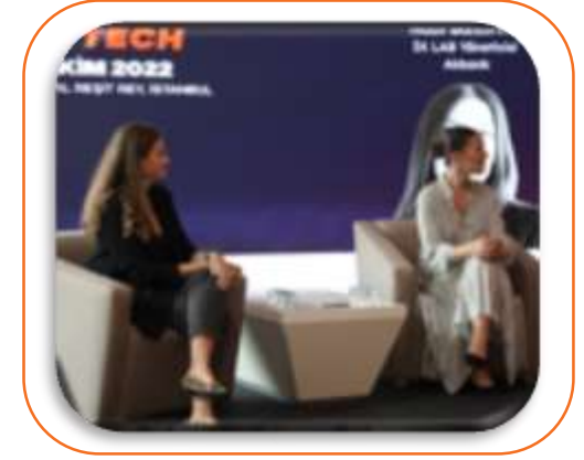
HR TECH OTURUMLARI 20 DK